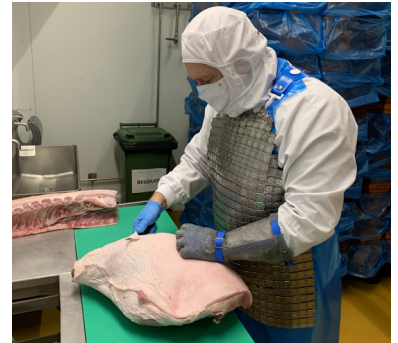
Consultor del DMRI realizando un escandallo

DMRI proporciona toda la formación y entrenamiento necesarios para los directores, jefes de sala y línea y trabajadores acerca de cómo mejorar los rendimientos y mantenerlos de forma estable. Los rendimientos y desviaciones en curso son monitoreados objetivamente por las herramientas de software Yield Manager & Yield Inspector del DMRI.