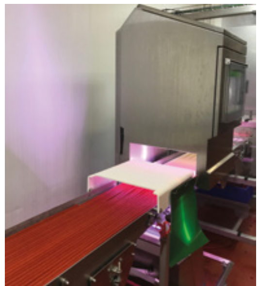
Doppelseitiges Screening der Würste für die Suche nach Plastikhüllenresten.

Viele Wursthersteller verwenden Kunststoffhüllen, die vor der Verpackung vollständig zu entfernen sind. Die Gewährleistung, dass jede Wurst auf verbleibende Hüllenfragmente in ihrem vollen Umfang überprüft wird, ist eine kostspielige, zeitaufwendige und ermüdende Arbeit. Die Sicherstellung der Abwesenheit von Kunststoff im Endprodukt ist für viele Fleischproduzenten ein wachsendes Problem. Ein nicht zuverlässiger Prozess kann zu Rückrufaktionen und Vertrauensverlust auf dem Markt führen, was mit hohen Kosten verbunden ist. Die DynaCQ Dual-Lösung verwendet eine obere Kamera, welche die Oberfläche der Wurst und eine untere Kamera, welche die untere Seite durch einen Spalt im Band erfasst.