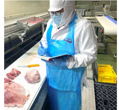
Consultor del DMRI haciendo un escandallo

Con el nuevo Programa de mejora de rendimientos del DMRI y la involucración de todo el personal en Frigolouro, el proyecto ha terminado con mejores resultados económicos de los que se esperaban en un principio, mostrando un notable incremento económico con mejoras de la calidad. Desde el principio de la cooperación, Frigolouro también se ha beneficiado de los nuevos sistemas de trabajo y el enfoque continuo de los responsables en los Puntos Clave de Control y los Indicadores de Rendimiento, lo que sin duda ha contribuido a asegurar unos cortes de carne más uniformes.